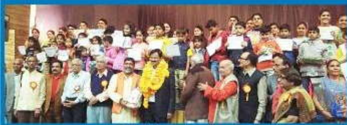
मुख्य अतिथियों के साथ सम्मानित प्रतिभाएँ ।